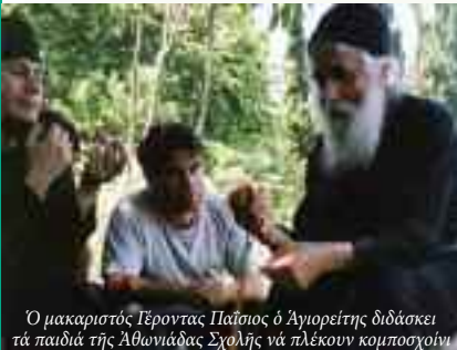
Ὁ μακαριστός Ἐρποντάς Παῖσιος ὁ Ἀγιορείτης διδάσκει τὰ παιδιά τῆς Ἀθωνιάδας Σχολῆς νά πλέκουν κομποσχοῖνι.

Κομποσχοῖνι εἶναι ἓνα μαῦρο σχοῖνι, σάν κομπολόι, φτιαγμένο ἀπό συνεχεῖς κόμπους. Ὁ κάθε κόμπος ἀποτελεῖται ἀπό 9 πλεγμένους σταυρούς, πού συμβολίζουν τὰ ἐννέα τάγματα τῶν ἀγγέλων. Παρότι ὁ ἀριθμός τῶν σταυρῶν πού ἀποτελοῦν κάθε κόμπος παραμένει πάντα σταθερός, ὁ ἀριθμός τῶν κόμπων πού ἀποτελοῦν τό κομποσχοῖνι ποικίλει. Ὑπάρχουν κομποσχοῖνια πολύ μικρά, στό μέγεθος τοῦ βραχιολιοῦ, μέ τριάντα τρεῖς κόμπους, ὅσα δηλαδή ἦταν καί τὰ χρόνια τῆς ἐπίγειας ζωῆς τοῦ Ἰησοῦ Χριστοῦ. Ὅσα ἔχουν 99 κόμπους, εἶναι ὁ ἀριθμός 33, ὅσα τὰ χρόνια τοῦ