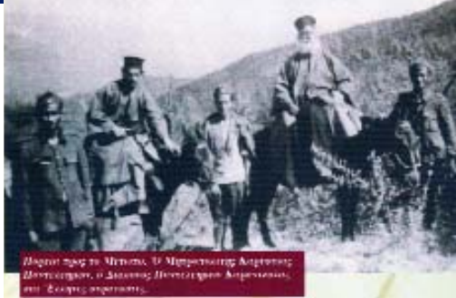
Μαρτίο 1943, ἡ Μονή Κασῶν Σητείας. Ὁ Μητροπολίτης Ἀργυρίου Μοντεκαταλίνο, ὁ Δαμασκηνός Ποντελεγγάκος Ἀργεντινῆς, στή Φεστίβα ἀπελευθέρωσης.

είσοδο τους στην Ἀθήνα ἀπάντησε: «Δέν ἔχει θέση ἡ δοξολογία στήν ὑποδούλωση τοῦ ἔθνους, ἀλλά ἡ ὥρα τῆς δοξολογίας θά εἶναι ἄλλη», ἐνῶ ὅταν τόν κάλεσαν νά παραδώσει τήν Ἀθήνα στούς κατακτητές εἶπε: «Οἱ Ἕλληνες ἱεράρχες δέν παραδίδουν τίς πόλεις στόν ἐχθρό, ἀλλά καθῆκον τους εἶναι νά ἐργαστοῦν γιά τήν ἀπελευθέρωσή τους». Ὅταν οἱ Γερμανοί κυνηγοῦσαν τούς Ἑβραίους τῆς